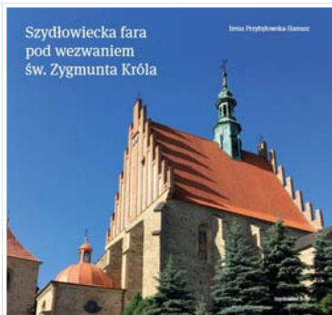
Szydłowiecka fara pod wezwaniem św. Zygmunta Króla

STOPKA REDAKCYJNA: Wydawca: Urząd Miejski w Szydłowcu, Rynek Wielki 1, 26-500 Szydłowiec Adres redakcji: Wydział Informacji i Promocji, ul. Kilińskiego 10, 26- 500 Szydłowiec Redaktor naczelny: Justyna Jezierska - Naczelnik Wydziału Informacji i Promocji Urzędu Miejskiego